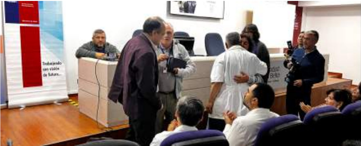
** Reconocimiento a CCU por su aporte a confección Portal del Paciente y su labor