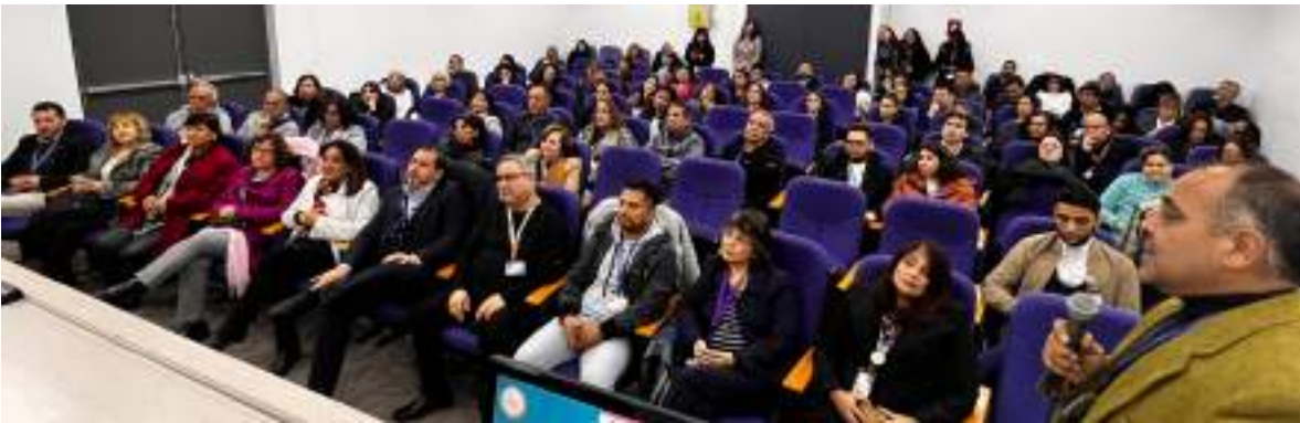
** Cuenta Pública HEP 2023